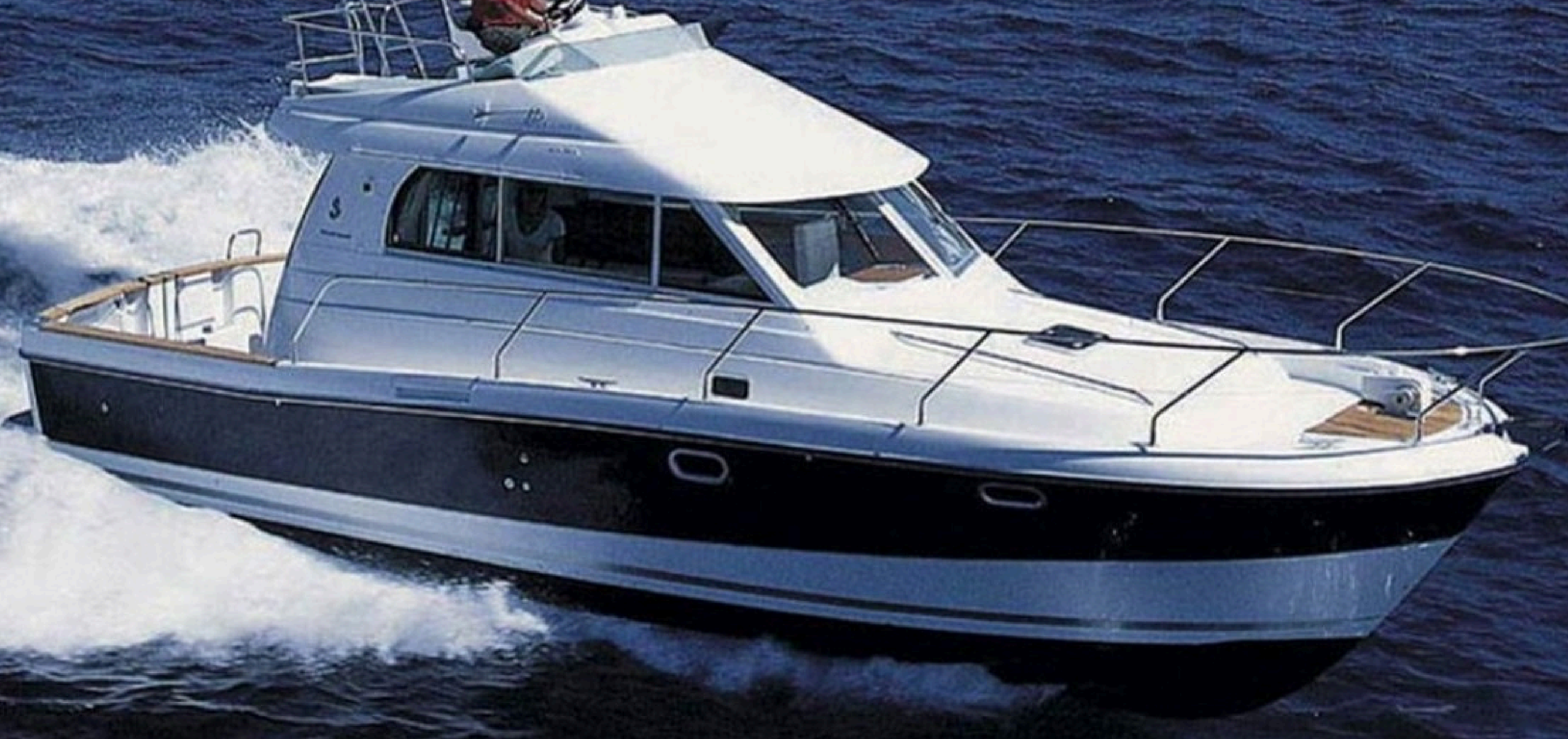
Beneteau Antares 10.80 - *PIEGE 85 000 € TTC